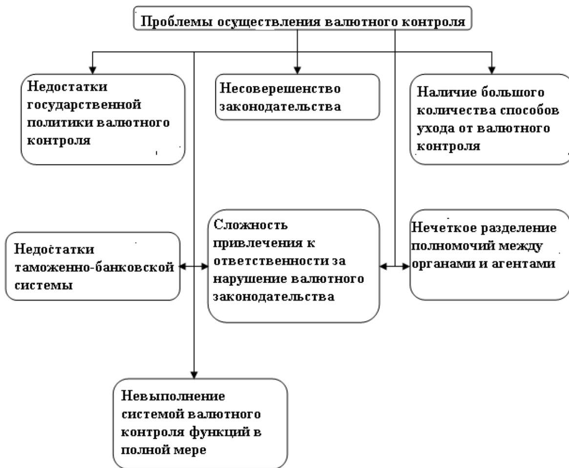
Рис. 1. Проблемы осуществления валютного контроля